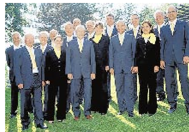
Tolles Abschiedsmeeting: OK Weltklasse Zürich