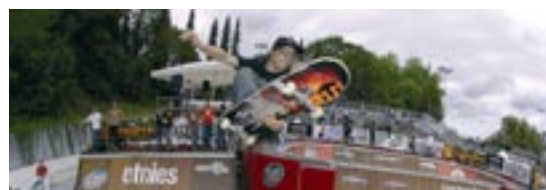
Sportsonntag: Spiel und Spass für die ganze Familie

WinterthurerInnen, die sich Ende August einen ganz besonderen Familienpass gönnen wollen, pilgern am Sonntag 27. August mit Sicherheit zur offenen Rennbahn in Zürich-Oerlikon. Dort steigt eine amüsante Familienparty.